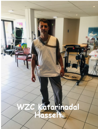
WZC Katarinadal Hasselt

vloog dit jaar weer voorbij waardoor we helaas niet door onze planning geraakten. Deze gemiste plaatsen staan al ingepland voor 2024. Op volgende plaatsen geraakten we gelukkig wel.