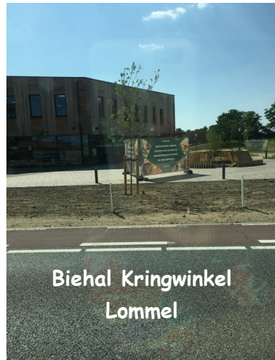
Biehal Kringwinkel Lommel