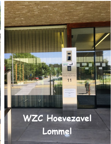
WZC Hoevezavel Lommel