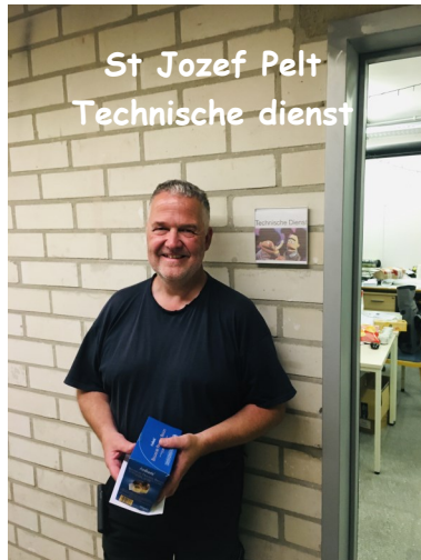
St Jozef Pelt Technische dienst